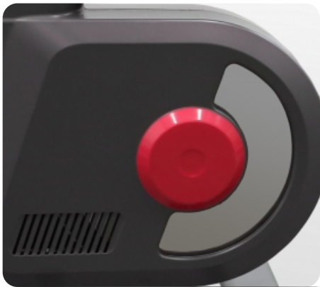
Система нагружения MAGNEX