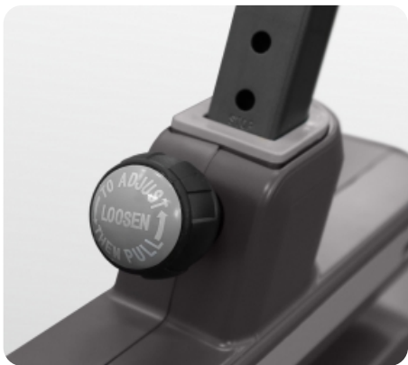
Регулировка сиденья по вертикали