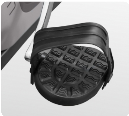
Рифленые антискользящие педали с прорезиненными многопозиционными ремешками