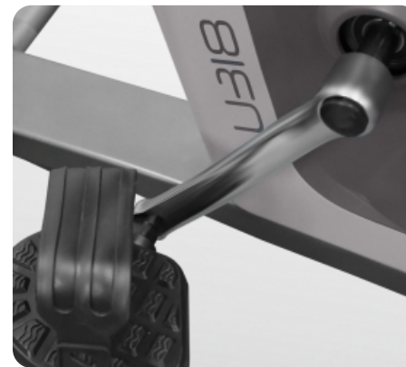
Трехкомпонентный педальный узел