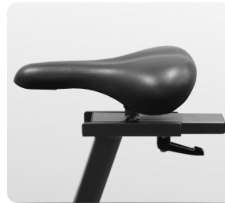
Регулировка сиденья по горизонтали