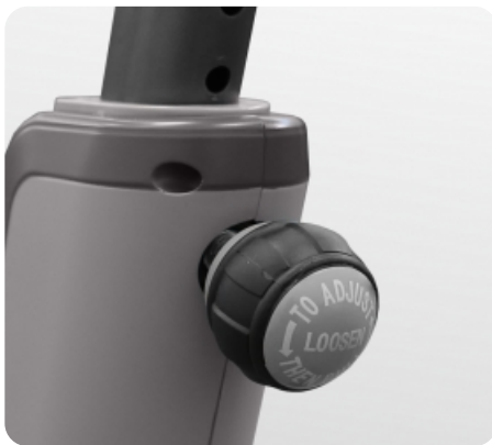
Регулировка руля по вертикали