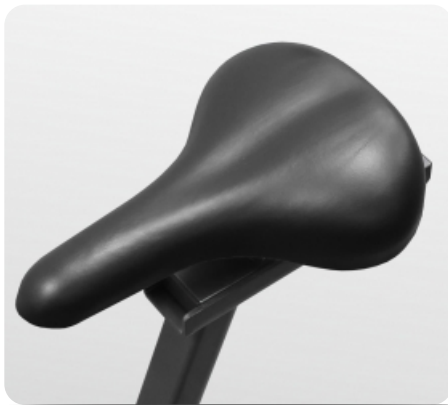
Сиденье повышенной комфортности