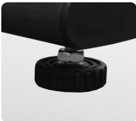
Компенсаторы неровностей пола