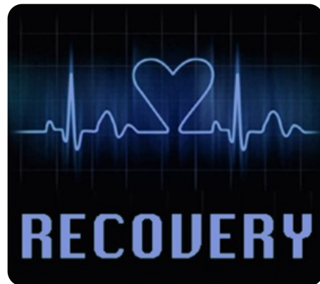
Recovery (оценка восстановления пульса)