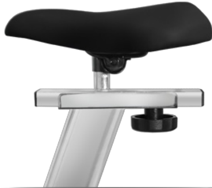
Регулировка сидения по горизонтали