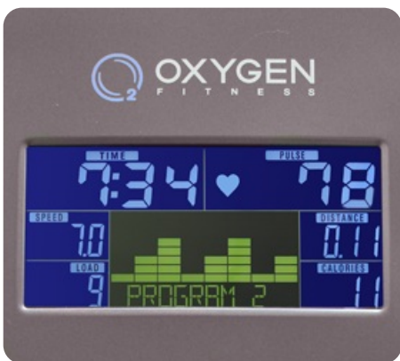
5.5 дюймовый (14 см.) цветной многофункциональный LCD дисплей