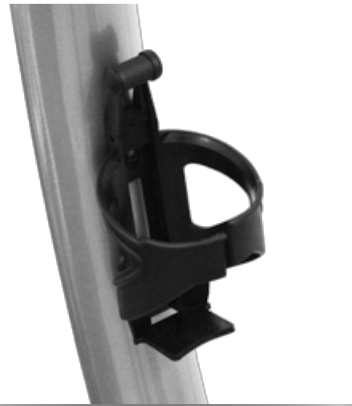
Держатель для бутылки