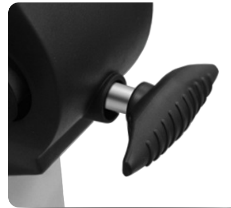
Регулировка положения руля