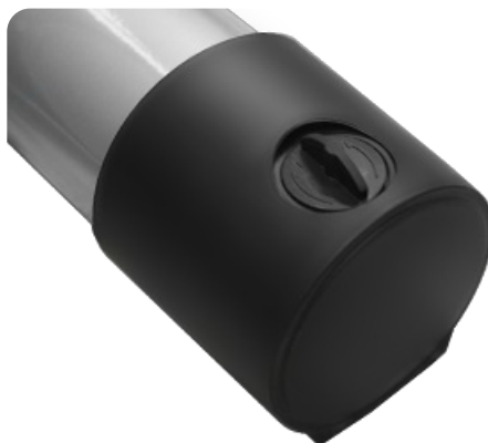
Компенсаторы неровностей пола