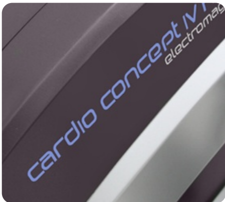
Строгий элегантный дизайн от норвежской студии Strekkgole