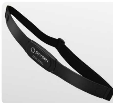
Беспроводной передатчик пульса Oxygen™ входит в комплект