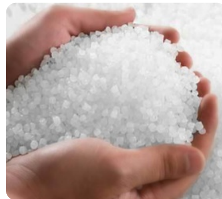
Только "свежие" переработанные пластмассы