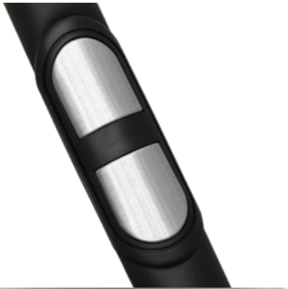
Сенсорные датчики пульса