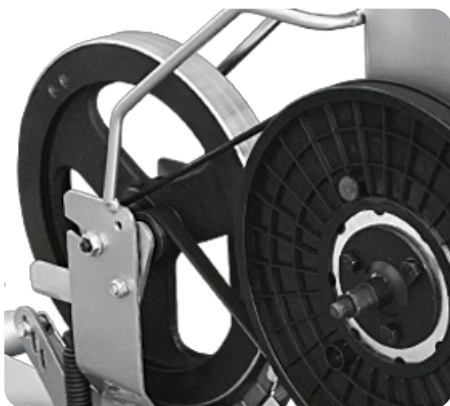
Элементы электромагнитной приводной системы magicFLOW™