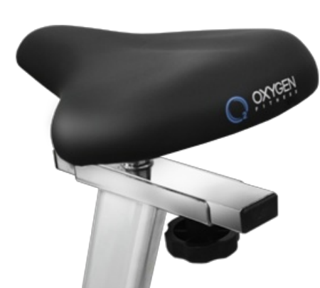
Сидение с гелиевым наполнителем