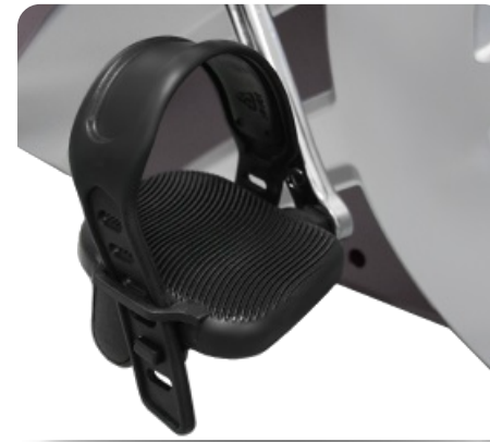
Антискользкие педали с регулируемыми ремешками