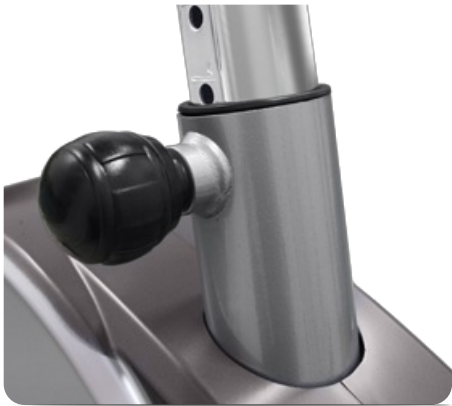
Регулировка сидения по вертикали